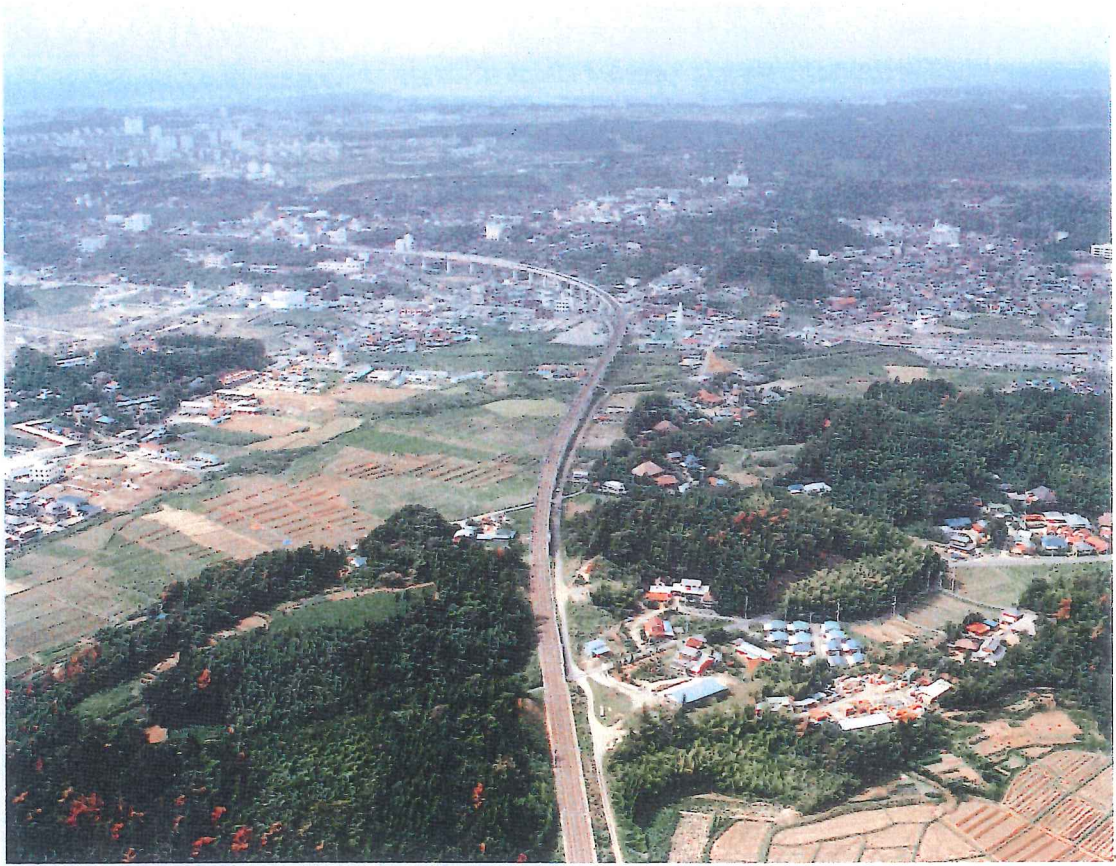
空港に向かって進む新線工事